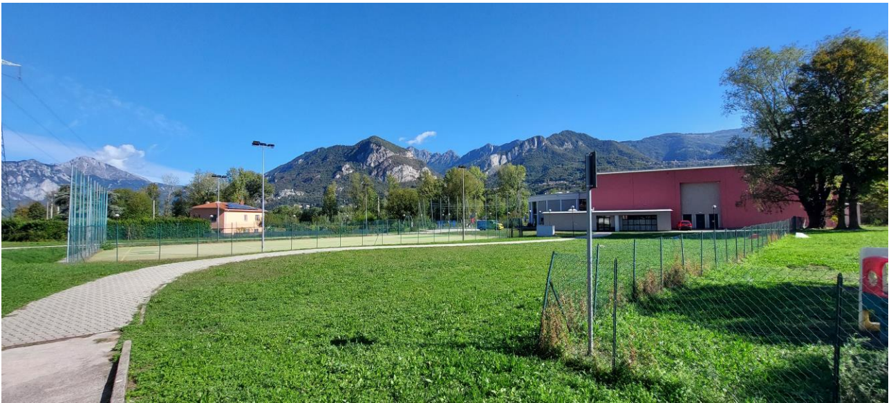
Foto area su cui insisterà il nuovo fabbricato