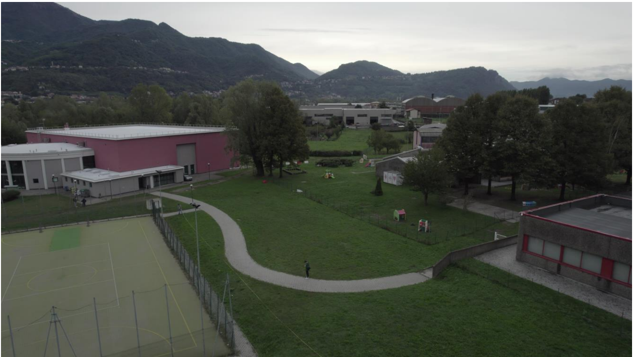
Foto aerea area in cui è prevista la costruzione