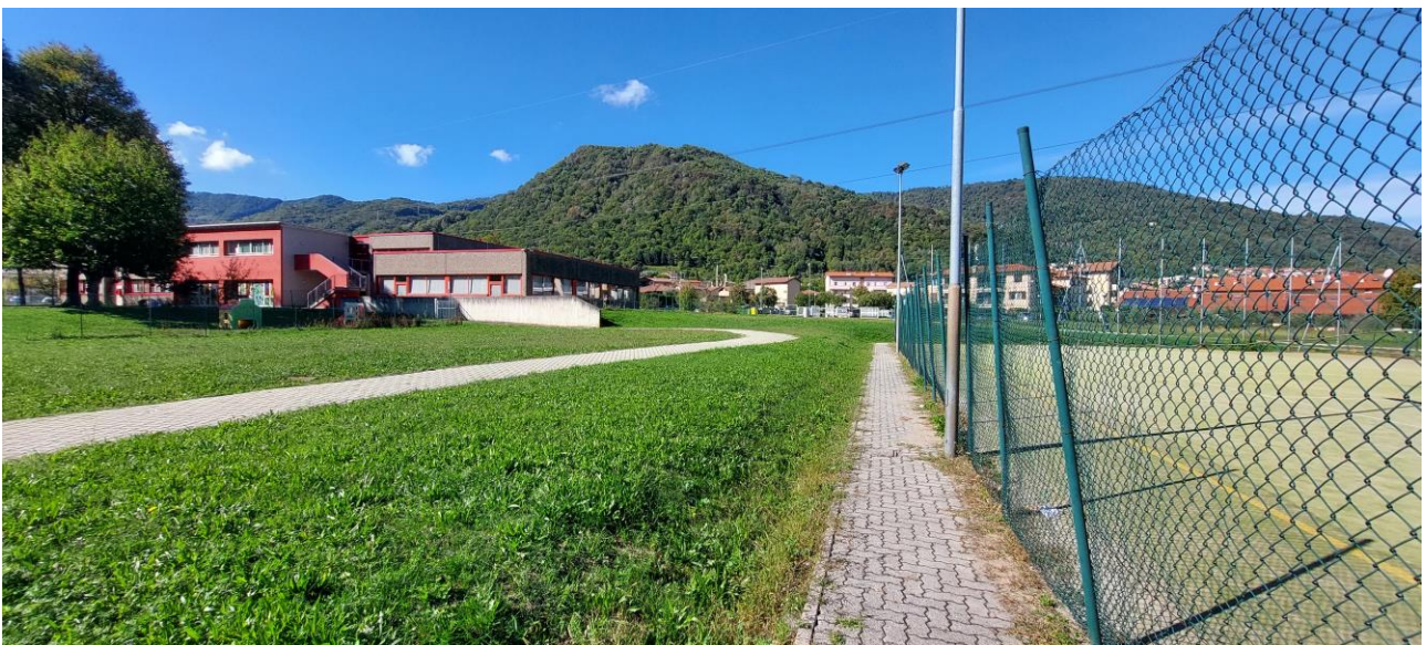
Foto area su cui insisterà il nuovo fabbricato