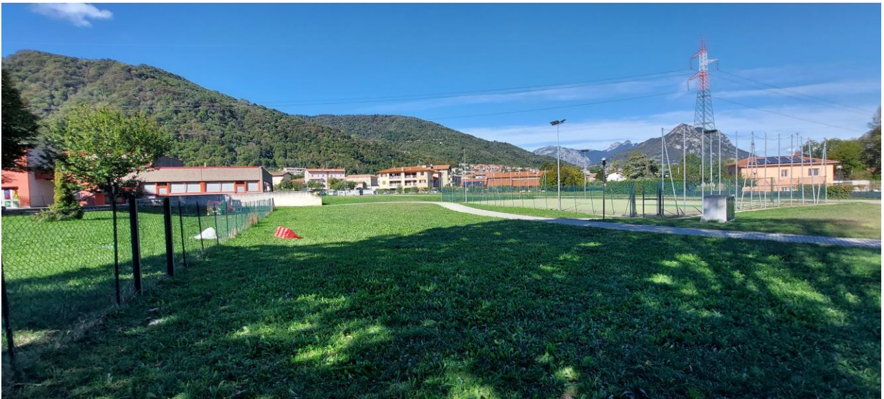
Foto area su cui insisterà il nuovo fabbricato